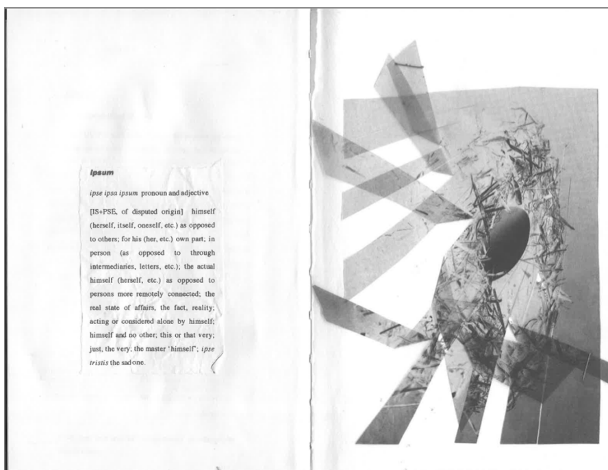
Anne Carson, Nox (2010)

Jeudi 8 février 2024 de 17h à 18h30 (Sorbonne, bibliothèque de l'UFR)